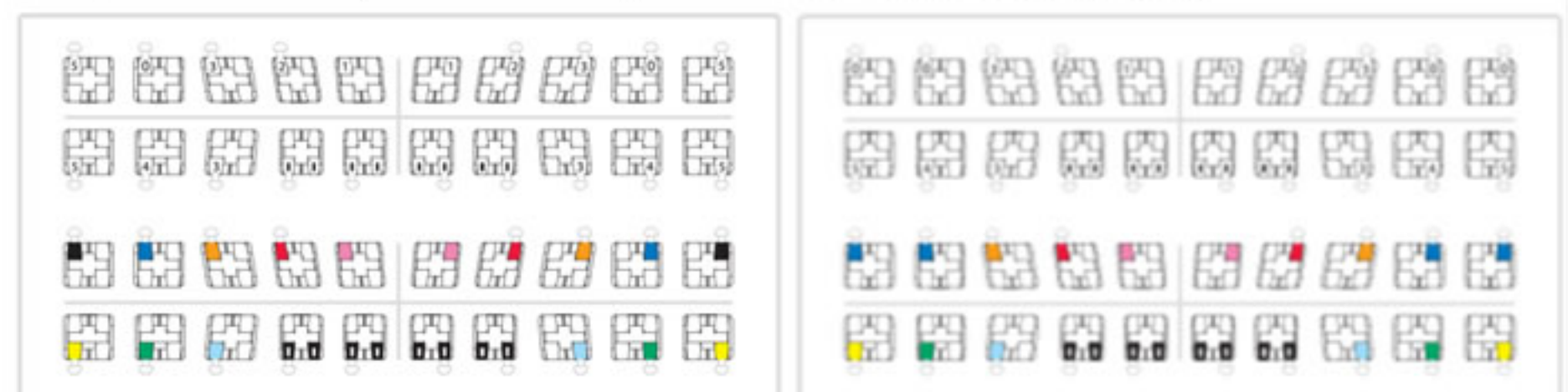
Micro Sprint® Brackets Roth System

マイクロ スプリント ブラケットは、ロス システム*、M/B/T システム*の二つのテクニックが用意され、.018、.022 スロット、そして側切歯、犬歯、小臼歯にフックを選択することができます。