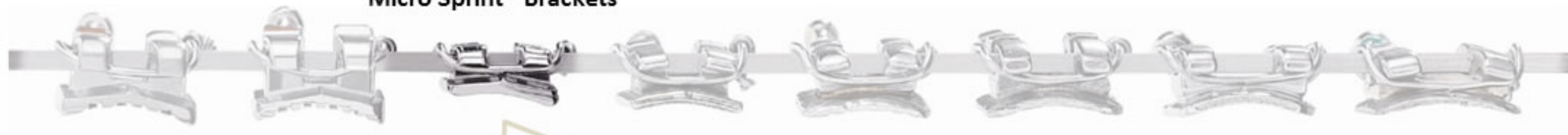
Micro Sprint® Brackets