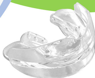
成人用ハビット コレクタースレンダライズ