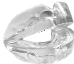
ナイトガイド ("C" シリーズ)